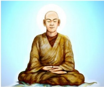
Phật hoàng Trần Nhân Tông

Cư trần lạc đạo thả tùy duyên, Cơ tắc xan hề khốn tắc miên. Gia trung hữu bảo hưu tầm mịch, Đối cảnh vô tâm mạc vấn Thiên.