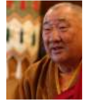
Đức Đạt Lai Lạt Ma thứ 14 (hình trái)